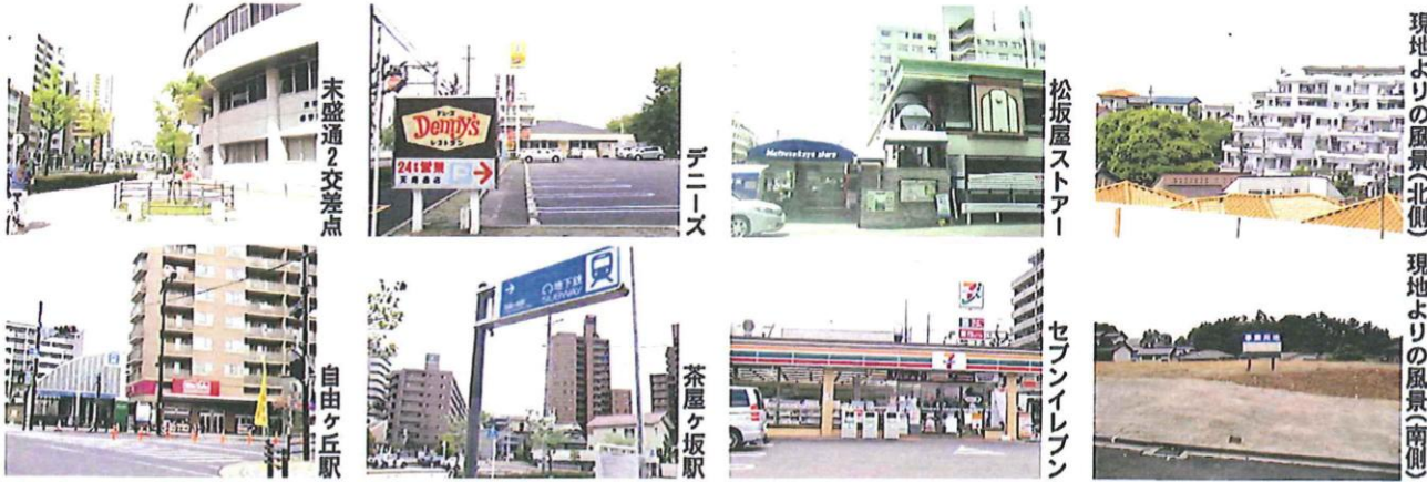
現地よりの風景(北側) 現地よりの風景(南側)